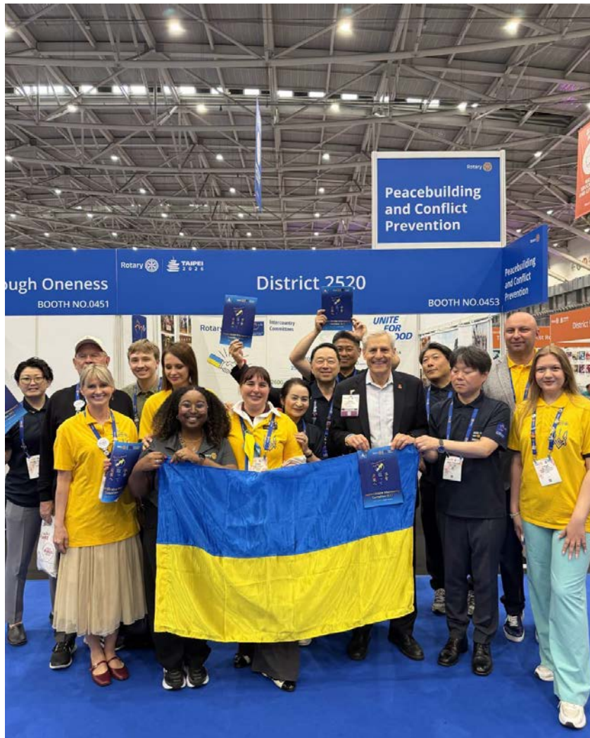
「友愛の広場」(House of Friendship)の日本-ウクライナ国際共同委員会(ICC)ブースに、国際ロータリー事務総長兼CEOのジョン・ヒューコ氏が訪問された際の記念撮影

台北での開催は32年ぶり2回目。国境を越えて知識を交換し、交友を深める絶好の機会となりました。会場の台北ドームと台北南港展示ホールは活気に包まれ、参加者はお互いに情報を交換し啓発し合いながら大いに盛り上がりました。